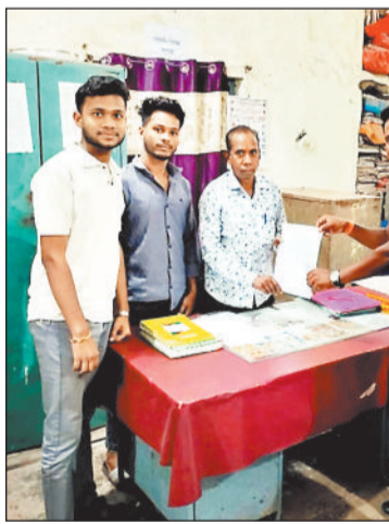
उपार्जन केंद्र को उप मंडी का दर्जा है प्राप्त, 18 सौ किसान पंजीकृत

आरओ केंद्र लगाया गया है, जिसमें अधूरा कार्य हुआ है। शिवसेना अध्यक्ष ने आगे बताया कि बिना काम पूर्ण हुए स्वीकृत राशि का बोर्ड लगा दिया गया है जो नियम के खिलाफ है। शिवसेना कार्यकर्ताओं ने मुख्यकार्यपालन अधिकारी को ज्ञापन देकर दोषियों के खिलाफ कार्रवाई करने की मांग की है।