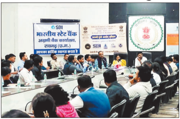
छत्तीसगढ़ राज्य ग्रामीण बैंक सहित अन्य बैंकों के अधिकारियों ने उपस्थित रहकर लंबित प्रकरणों तथा नए इच्छुक उद्यमियों के साथ प्रत्यक्ष संवाद किया। उपस्थित उद्यमियों ने अपने व्यापार से जुड़ी समस्याओं को साझा किया, जिन पर बैंक अधिकारियों द्वारा समाधान प्रदान किया गया। मौके पर ही लंबित ऋण प्रस्तावों पर कार्यवाही की गई। 8 उद्यमियों को विभिन्न बैंकों द्वारा ऋण प्रदान करने की सहमति दी गई तथा 6 इकाइयों को कार्यशाला में ही ऋण स्वीकृत पत्र प्रदान किए गए।

आ यो ज न किया गया। इस कार्यक्रम में जिले के सूक्ष्म, लघु एवं मध्यम उद्यमी, स्वयं सहायता समूहों के प्रतिनिधि तथा प्रधानमंत्री सूक्ष्म खाद्य प्रसंस्करण उद्यम-उत्पन्न योजना और प्रधानमंत्री रोजगार सृजन कार्यक्रम के लगभग 70 हितग्राहियों ने सहभागिता की। जिले के भारतीय स्टेट बैंक, बैंक ऑफ इंडिया, पंजाब नेशनल बैंक,